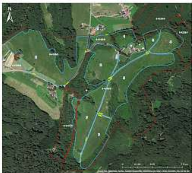
Lageplan Beweidungsprojekt Langenhard (gestrichelte Linie = Zaunverlauf)

Offenburg, den 04.09.2019 Pfüller, Forstdirektor