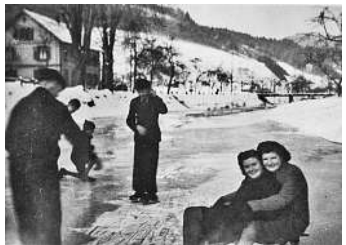
Bild Nr. 742: Foto aus der unmittelbaren Nachkriegszeit! Bis zur Mitte des vorigen Jahrhunderts kam es öfters vor, dass der Wolfbach zufror. In vielen Häusern hatte man deshalb auch Schlittschuhe parat, obwohl ansonsten in bescheidenen Verhältnissen lebte.