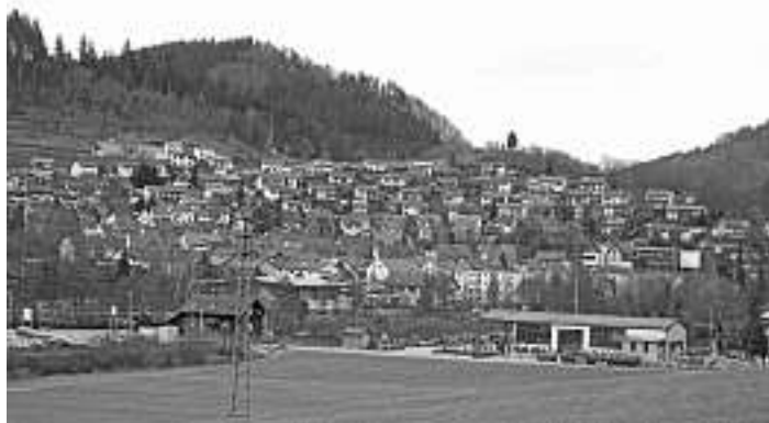
Blick vom Schmittegrund in Richtung Ehrenmal und Wolfach

auf Corona tatsächlich zur Durchführung kommen kann, das wird an dieser Stelle und aktuell im „Kästle“ beim „Posthörle“ sowie in der Homepage unter www.schwarzwaldverein-oberwolfach.de mitgeteilt.