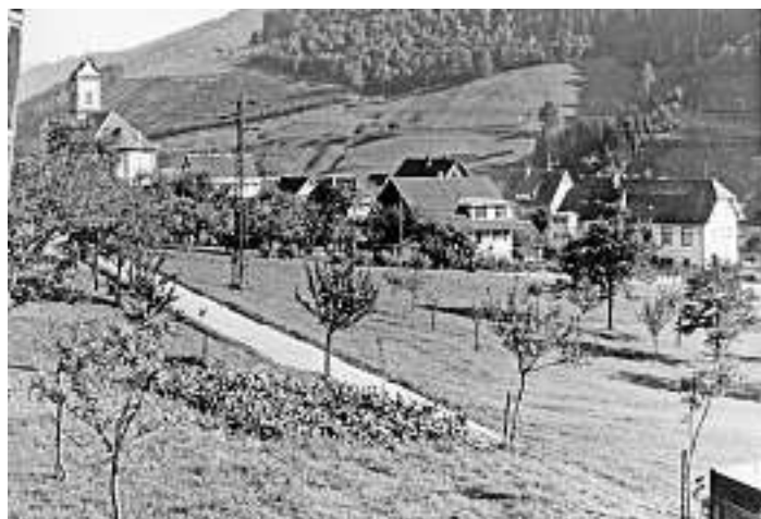
Bild Nr. 730: Blick in den frühen sechziger Jahren vom noch unbebauten Kirchberg mit der Friedensstraße auf das damalige Altersheim und hinüber zum Müllerrain.