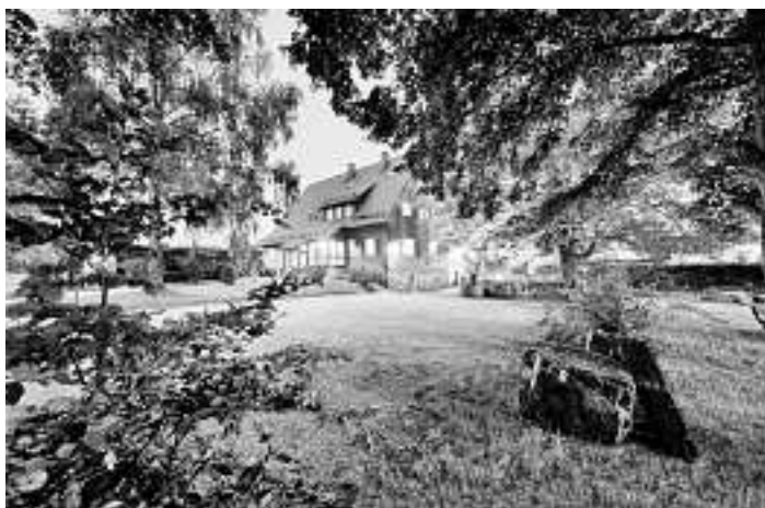
Foto: Wanderheim in Zavelstein

Die Wanderung beginnt beim Wanderheim in Zavelstein. Die abwechslungsreiche Tour führt über Streuobstwiesen und durch romantische Täler auf fußfreundlichen Pfaden und mit vielen herrlichen Aussichten. Die Wanderstrecke ist ca. 14 Kilometer lang und beinhaltet 380 Höhenmeter. Ein Rucksackvesper sollte man einpacken. Abschließend wird man im Wanderheim Zavelstein einkehren, wo beliebte schwäbische Spezialitäten auf der Speisekarte stehen. Auch Gäste sind zum Mitwandern eingeladen!