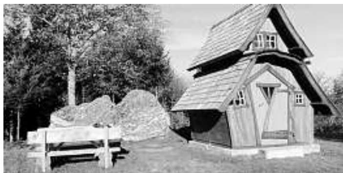
Foto: Hexenhäuschen auf dem Sohlberg

Die anspruchsvolle Rundwanderung führt uns auf den Höhenkamm von Lautenbach im Renchtal. Über historische Wege wie dem Allerheiligensteig und auf neu angelegten Pfaden geht es durch eine abwechslungsreiche Landschaft mit herrlichen Aussichtspunkten mit weiter Sicht nach Straßburg und zu den Vogesen. Ein wahres Schmuckstück ist das Hexenhäuschen auf dem Sohlberg. Die gesamte Strecke beträgt 15 Kilometer. Der Aufstieg und Abstieg betragen jeweils 559 Meter. Es wird empfohlen, festes Schuhwerk, Rucksackverpflegung und ausreichend Getränke sowie Wetterschutzkleidung mitzunehmen. Auch an Wanderstöcke sollte man denken. Man trifft sich am Sonntag, 21. Juli um 7.30 Uhr am Schulplatz in Oberwolfach. Dort werden Fahrgemeinschaften bis nach Wolfach zum Bahnhof gebildet. Die Abfahrt mit der Bahn (OSB) ist um 8.20 Uhr. Hier werden Gruppenfahrtscheine gelöst. Auch Nichtmitglieder und Gäste sind zur Teilnahme eingeladen!