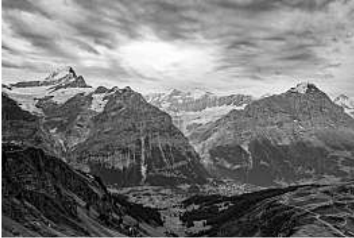
Foto: Wanderregion bei Grindelwald als Ziel der Oberwolfacher Bergwanderer