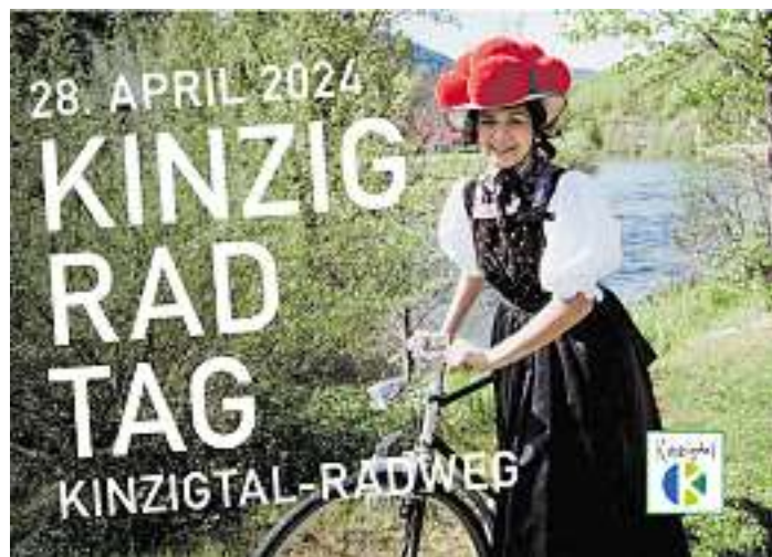
Kinzig Rad Tag – Werbegemeinschaft Kinzigtal-Radweg, André Riehle

Weitere Informationen und das vollständige Rahmenprogramm gibt es online unter www.kinzigtalradweg.de oder im Programmflyer, der unter anderem in der Tourist-Information Wolfach erhältlich ist.