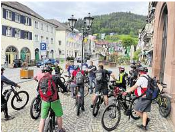
Archivfoto Sportliche Feierabendtour im Rahmen des STADTRADELN Wolfach 2023

Die Stadt Wolfach freut sich über viele Mitradelnde: Auf geht's – Anmelden und für Wolfach in die Pedale treten!