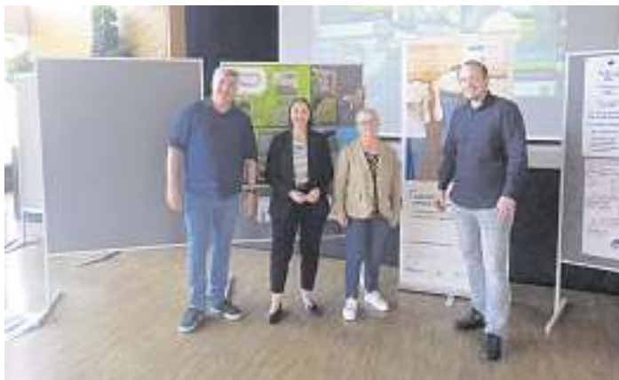
Tag der Begegnung 2024