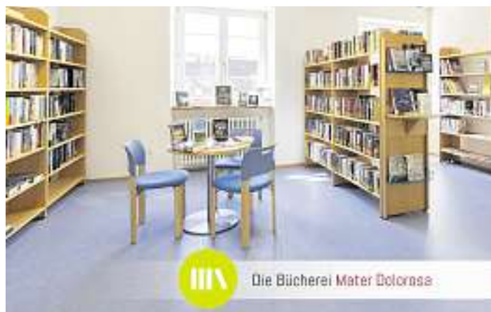
Die Bücherei Mater Dolorosa

Wer dringend noch Urlaubslektüre braucht, kann sich am Freitag, 9. August damit eindecken. Die Öffnungszeit ist von 16 – 18 Uhr. Wir freuen uns auf Ihren Besuch und wünschen einen schönen und sonnigen Lesesommer.