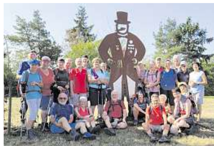
Die Skulptur des Quetschehannes stand den Wanderern vom Schwarzwaldverein Wolfach Pate.