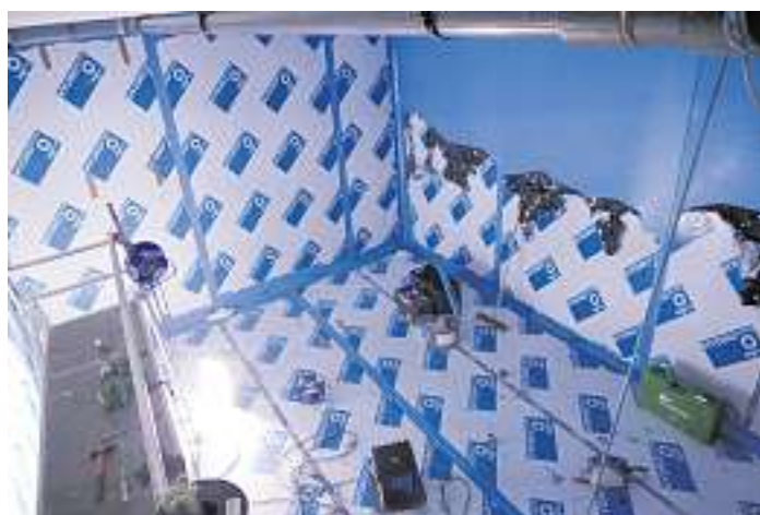
Laufende Sanierungsarbeiten in der zweiten Behälterkammer