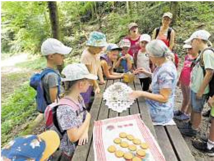
Die Großmutter zeigt den Kindern ihre neue Kaffeemühle

Der Sozialverband VdK Ortsgruppe Wolftal-Hausach lädt seine Mitglieder zum „Kaffeeklatsch“ am Freitag, 6. September, um 15 Uhr nach Wolfach in das „Flößercafé“ ein. Die Bevölkerung ist zu den Vorträgen und dem „Kaffee-