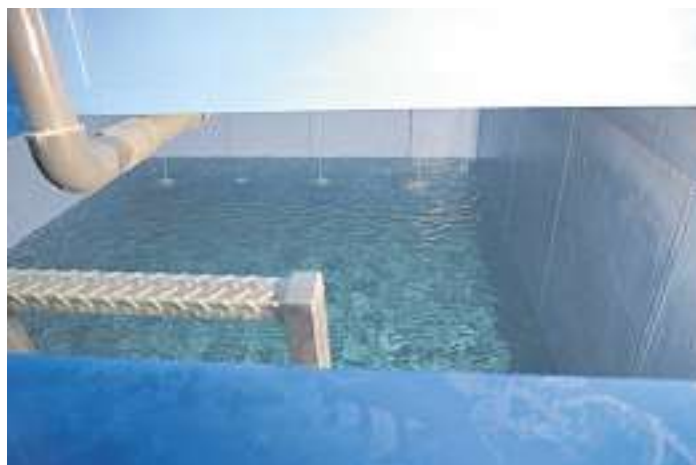
Noch nicht sanierte Behälterkammer

Die Kammern erhalten eine Auskleidung mit verklebten Kunststoffplatten, was dem neuesten Stand der Technik entspricht. Somit kann weiterhin eine sichere und hygienische Wasserversorgung gewährleistet werden.