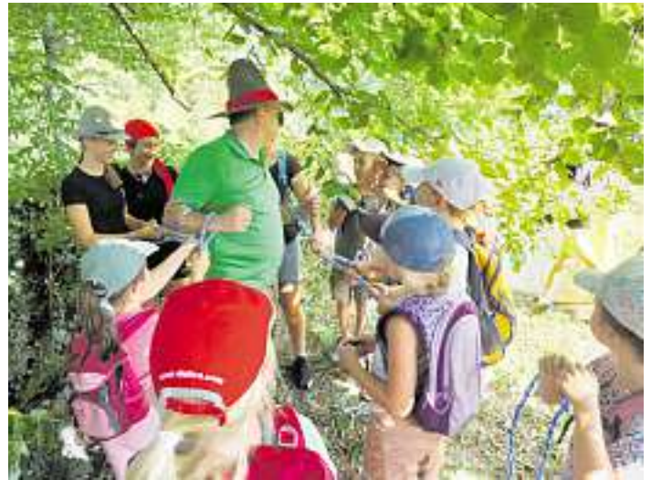
Der Räuber Hotzenplotz wird gefangen genommen und gefesselt

Am letzten Freitag trafen sich 13 mutige Kinder im Rahmen des Sommerferienprogramms, um sich auf die Spuren des Räuber Hotzenplotz zu begeben. Angeboten wurde dieser Nachmittag vom Team der Bücherei in Oberwolfach. Nach einer kurzen Vorstellungsrunde beim Weihermattenspielfeld ging es auch schon los die Großmutter im Fraueneckwald zu besuchen. Stolz zeigte sie den Kindern ihre neue Kaffeemühle, die sie zum Geburtstag von Kasperl und Seppe bekommen hat. Beim Weiterziehen erschrakten die Kinder durch einen grellen Schrei der Großmutter, die vom Räuber Hotzenplotz überfallen wurde und der ihr ihre schöne Kaffeemühle raubte. Die Kinder halfen nun tatkräftig bei der Suche nach der Kaffeemühle mit. Sie füllten einen Steckbrief aus, fanden die im Wald versteckten Messer und begegneten dem verzweifelten Polizisten Dimpfmose, dem es ganz peinlich war, dass der Räuber Hotzenplotz aus dem Gefängnis ausbrechen konnte. Unterwegs befreiten die Kinder noch die gefesselten Kasperl und Seppe, bevor sie schließlich den Räuber Hotzenplotz in seiner Höhle auf dem Schlössle fanden. Sie nahmen ihm die Kaffeemühle ab und fesselten den Räuber mit ihren Seilen. Stolz gaben die Kinder der Großmutter die Kaffeemühle wieder zurück und übergaben den Räuber Hotzenplotz an den Polizisten. Beim Abschluss auf dem Spielplatz stärkten sich die Kinder nach dieser anstrengenden Suche und bekamen für ihre tapfere Mithilfe eine Urkunde überreicht.