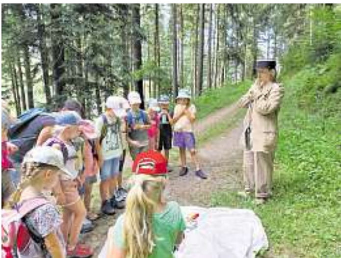
Die Kinder müssen dem verzweifelten Kommissar Dimpfmose bei der Spurensuche helfen