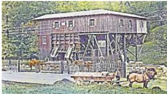
Bild 975: Wohl die älteste Aufnahme von der Verladestation am Wasser von 1910. Damals war noch Handarbeit gefragt und gleich drei Pferdegespanne warten darauf, den geförderten Schwerspat nach Wolfach transportieren zu können. Fünf Männer kann man beim Arbeitseinsatz erkennen. Kein Helm, sondern ein Hut diente damals noch als Kopfschutz