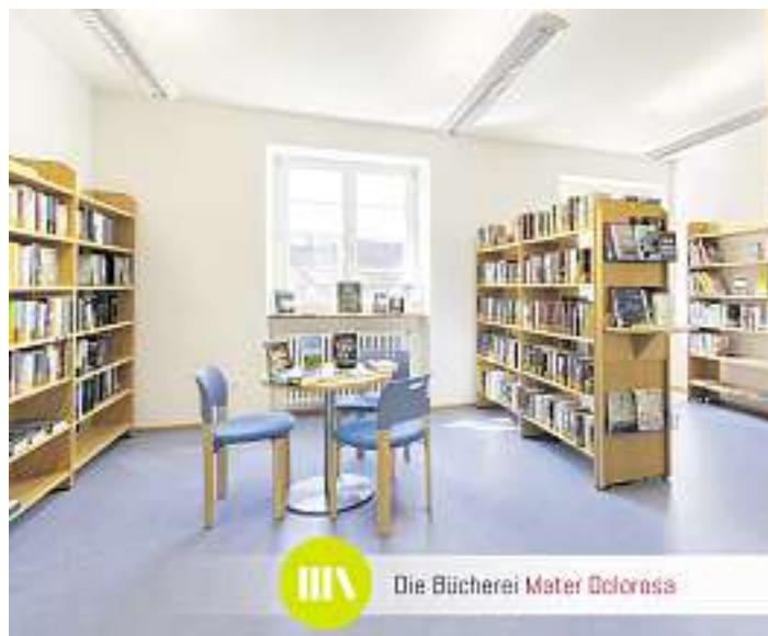
Die Bücherei Mater Dolorosa

Wir freuen uns auf Ihren Besuch und wünschen einen schönen und sonnigen Lesesommer.