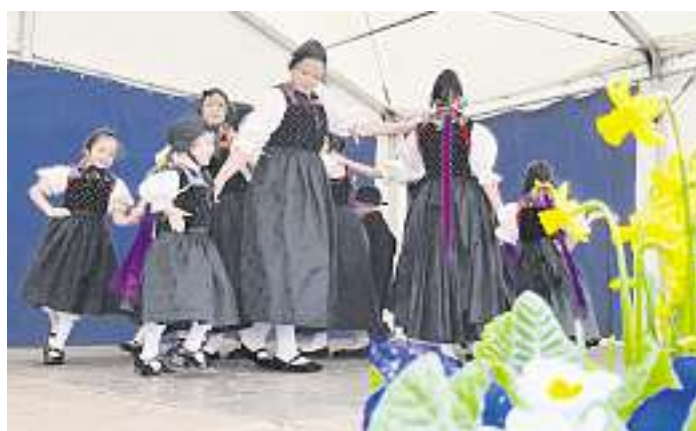
Die Kleine Kurrende Kirnbach

Alle kleinen Marktbesucher erfreuten sich am Bastel-Programm der KJG Wolfach am österlich geschmückten Stadtbrunnen, dem Kinderflohmarkt und der Hüpfburg im Schlosshof, den Vorlesungen der Katholischen Öffentlichen Bücherei und dem Kinderschminken im Zelt vor der Krone. Auch der Besuch des Osterhasen mit seinen österlichen Leckereien im Körbchen sorgten für strahlende Kinderaugen. Für das leibliche Wohl war mit einem bunt gemischten kulinarischen Marktangebot und der örtlichen Gastronomie für jeden Geschmack etwas zu finden.