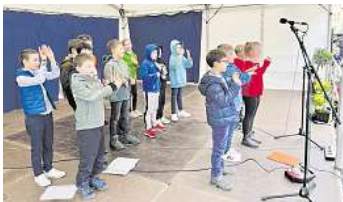
Der Schulchor der Herlinsbachschule

Allen Beteiligten gilt ein herzliches Dankeschön für dieses rundum gelungene Oster-Event.