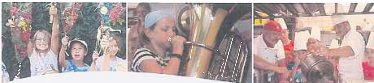
Sommerferienprogramm Wolfach / Oberwolfach