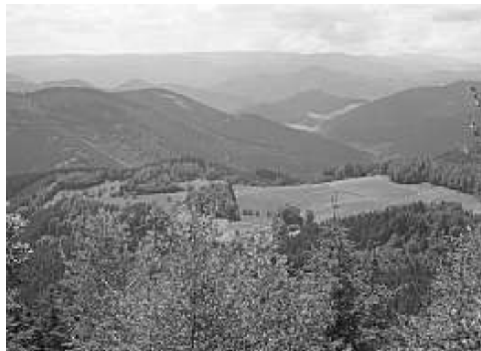
Ausblick über den Schwarzenbruch vom Gütschkopf aus über die Schrempehöhe ins Wolfstal hinunter und zum Farrenkopf

In Fahrgemeinschaften wird um 7.30 Uhr an der Wolfstalschule losgefahren. Um 7.30 Uhr wird die Fahrt bei der Marienkirche fortgesetzt und um 8 Uhr ist der Abmarsch beim Parkplatz unterhalb des „Schmalzerhisli“ geplant. Auch Gäste sind zur Teilnahme eingeladen.