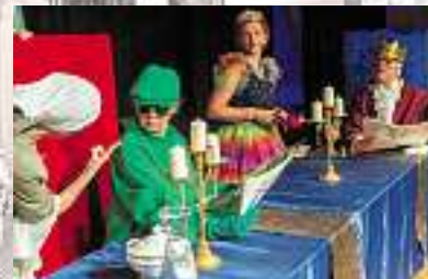
Eine Produktion der „Theaterbühne im Keller“ vom Kulturkreis Lahr e.V.

nach dem Märchen der Gebrüder Grimm Regie: Christopher Kern