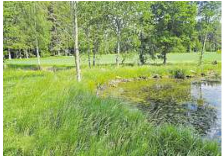
Projektgebiet Beschenhof.

Im September dieses Jahres wurden Tümpel entlandet und Ufer abgeflacht. Ziel der Maßnahme ist die Entstehung von Flachwasserzonen und kleineren Tümpeln. Die Arbeiten wurden mit einem Schreitbagger durchgeführt, der auf empfindlichen Flächen besonders bodenschonend arbeiten kann.