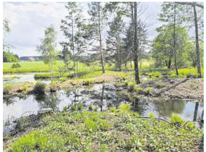
Weiher nach der Enthurstung.

Im Herbst 2023 wurden die Flächen erstmalig mit Schafen beweidet. Das Gebiet ist aktuell in einem guten Zustand, das Projekt wird zum Jahresende abgeschlossen. Das Feuchtgebiet soll auch künftig durch Beweidung offengehalten werden.