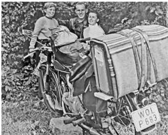
Bild Nr. 727: So startete man in den sechziger Jahren in den Urlaub: Der Reisekoffer wurde mit Lederriemen am Gepäckträger des Motorrads festgezurr, nachdem man ihn zuvor zum Schutz vor Regen mit einem alten Teppich umwickelt hatte! Seitentaschen und eine auf dem Tank aufliegende weitere Tasche durften nicht fehlen!