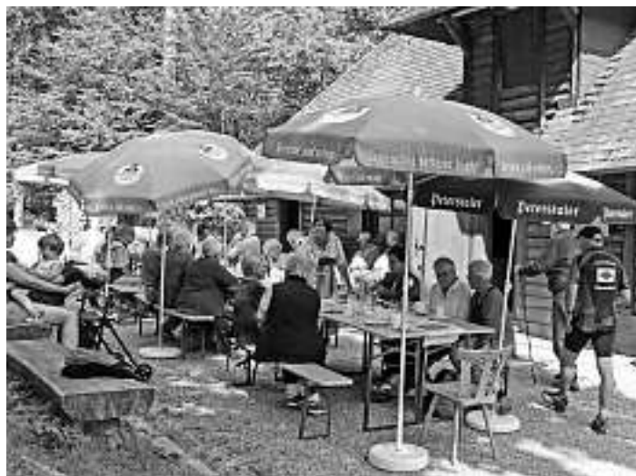
Senioren am Kreuzsattel – Frühwanderung in Bad Rippoldsau

Über einen außerordentlich guten Besuch freute sich die Trachtengruppe bei der Bewirtung am Sonntag am Kreuzsattel. Die 25 Kuchen und Torten waren nicht nur bei den eigenen Vereinsmitgliedern sondern auch bei den vielen Gästen heiß begehrt.