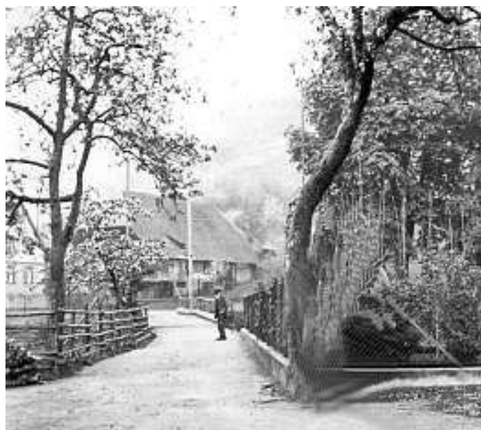
739 Grünachbrücke Kirchenbauernhof 1950 Alte Photographie

Bild Nr. 739: Blick von der „Breigass“ (breite Gasse) auf Grünach über die untere Grünachbrücke auf den Kirchenbauernhof, der 1951 niedergebrannt ist. Das Foto wurde um 1950 aufgenommen und wurde von Meinhard und Hilda Gebert dankenswerter Weise zur Verfügung gestellt.