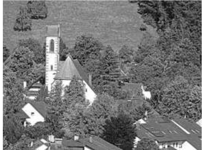
Foto: Kleinod im mittleren Kinzigtal: die Dorfkirche im Hauserbach!

Der Treffpunkt ist in Hausach am Gustav Rivinius-Platz um 14 Uhr. Alternativ werden Fahrgemeinschaften ab dem Schulplatz Oberwolfach um 13.30 Uhr angeboten.