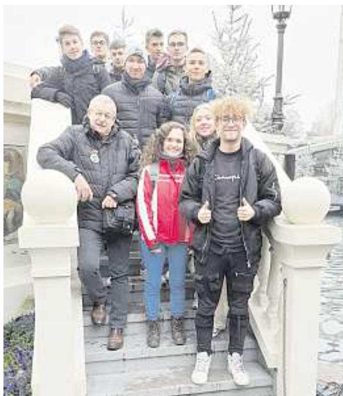
Die Klasse TG13 aus Wolfach im Europapark

Die 50 TeilnehmerInnen wurden in zwei Gruppen aufgeteilt und die Schülerinnen und Schüler konnten nacheinander einen Einblick in die Themen „Blick hinter die Kulissen der Achterbahn Blue Fire“ und „Nachhaltigkeit im Europapark“ nehmen. Die Führungen durch Mitarbeiter des Europaparks waren mit einem Quiz über technische Details verbunden, bei dem zum Schluss pro teilnehmender Klasse eine Eintrittskarte für den Europapark verlost wurde. Das Thema Nachhaltigkeit umfasste unter anderem Informationen über die Nutzung von Wasserkraft, Filteranlagen und die Abfallwirtschaft. Nach einem Imbiss um 13.00 Uhr endete der offizielle Teil der Veranstaltung und die Teilnehmerinnen und Teilnehmer durften sich noch für den Rest des Tages im Europapark vergnügen.