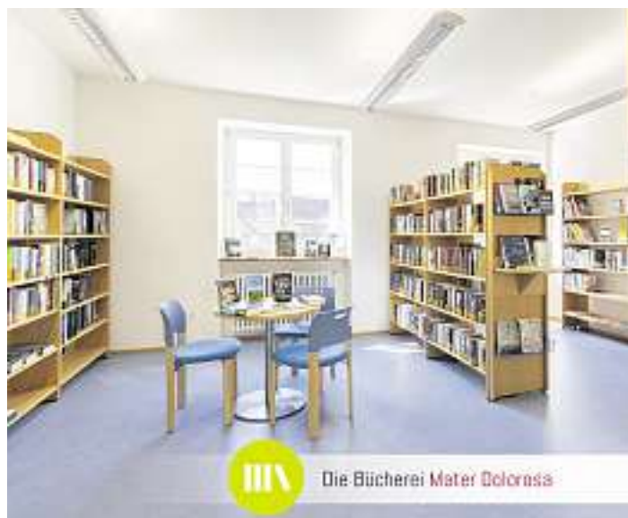
Die Bücherei Mater Colorada