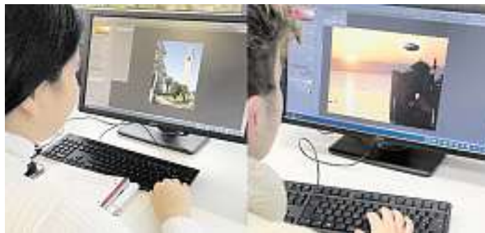
Schüler der Klasse 1BK1T beim Erstellen von FAKE-Bildern in Photoshop

Neben dem Spaß bei der Ausführung dieser Aufgabe und dem Erlernen des Umgangs mit der neusten Photoshop-Version erkannten die Schülerinnen und Schüler quasi nebenbei, wie einfach es ist, eine Falschnachricht im Bild zu erzeugen. Neben den praktischen Kenntnissen wurde somit ebenfalls Erkenntnisse zu den Gefahren von FAKE-News vermittelt.