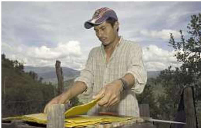
Die Imkerei bringt neue Perspektiven auch für junge Menschen und trägt dazu bei, Migration in die Städte oder in die USA zu verhindern.

Am 20. Mai ist Weltbienentag – haben Sie das schon im Kalender stehen? Die UN wollen mit dem Tag die elementare Bedeutung von Bienen für die Biodiversität und die Ernährungssicherheit hervorheben. Wir nutzen diesen Anlass, um Ihre Aufmerksamkeit auf unser Honigsortiment zu lenken. Muss es denn unbedingt Honig aus Übersee sein? Nun, nur 30 Prozent des Honigbedarfs in Deutschland wird auch mit deutschem Honig gedeckt. Deshalb wird viel Honig importiert – dann aber doch wenigstens fair, oder? Unser Honigsortiment befindet sich gerade in der Umstellung, Sie können schon erste Gläser mit neuem Etikett finden. Bio ist unser Honig schon, in Zukunft wird er auch klimaneutral sein – von der Wabe bis ins Glas. Der beliebte Klassiker, der Mexiko-Honig aus dem Lacandona-Urwald, bleibt natürlich im Sortiment, auch er wird klimaneutral. Durch den Fairen Handel haben die Mitglieder der Imker-genossenschaften die Chance auf ein besseres Leben und Zusatzeinkünfte. Da Bienenhaltung wenig Ressourcen erfordert, was Landnutzung, Materialeinsatz oder Wasserverbrauch angeht, können sie damit auch die Abhängigkeit von anderen Produkten wie Kaffee verringern. Aber gut, dass das nur für die Imker gilt – Ihre Abhängigkeit vom Kaffee gehört ja zu unserem Geschäftsmodell. ;-)