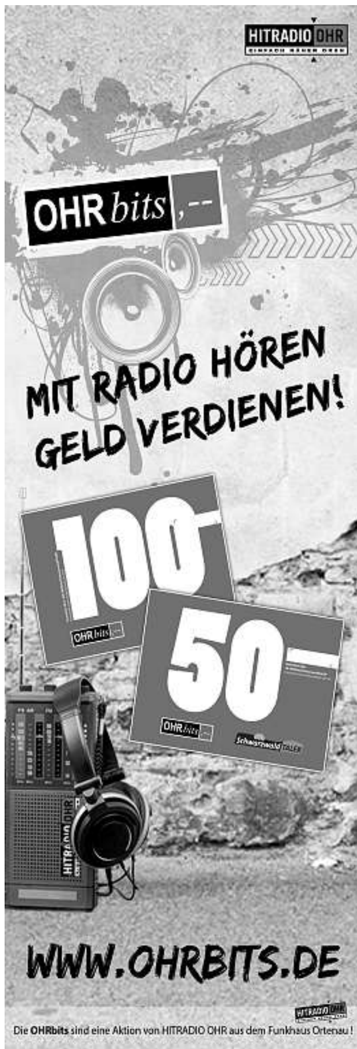
Die OHRbits sind eine Aktion von HITRADIO OHR aus dem Funkhaus Ortenau!

- 23.05.2021, Heimatabend der Trachtengruppe Oberwolfach