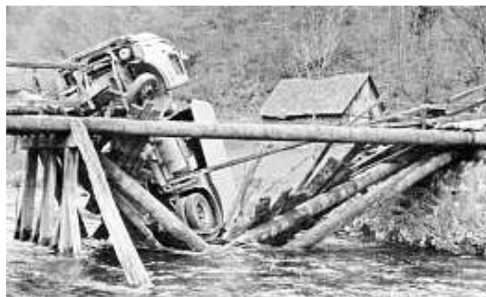
Foto -Nr. 767: Auch schon um die vierzig Jahre ist es her, seit man es bei der Venturbrücke mit der Straßenreinigung zu genau nahm!