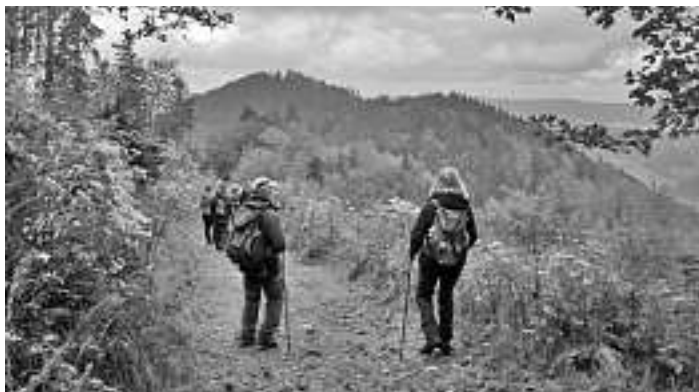
Über das Griesbacher Eck

Bitte beachten: Eine Bild-Reportage im Internet unter www.schwarzwaldverein-oberwolfach.de