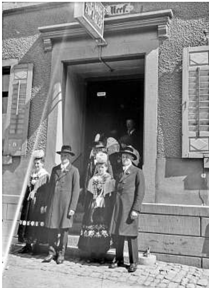
Foto Nr. 783: Ebenfalls ein Bild des Leipziger Fotografen Johannes Mühler, der um 1930 wohl mehrfach im Wolfstal weilte und wahrscheinlich hier mit Frau und Töchtern auch Urlaub machte. Fotografiert wurde eine Doppelhochzeit, die offensichtlich im Wolfacher „Adler“ gefeiert wurde. Kann jemand Näheres dazu sagen? Waren die Bräute Schwestern, die Ehemänner Brüder – oder gar beides?