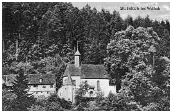
Sankt Jakob in Wolfach auf historischer Ansichtskarte!