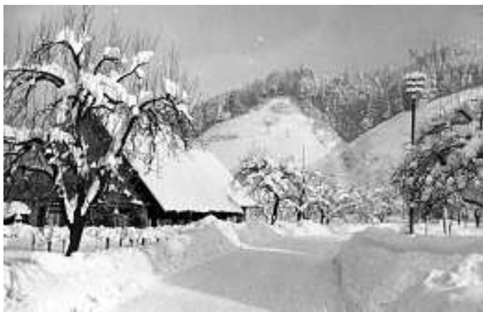
Bild Nr. 749: Nochmals ein Winterfoto von dem extremen Schneewinter um 1950. Diesmal ein Blick auf die Häuser Schmid und Iesenmann an Landstraße, die bereits in den sechziger Jahren der Ausdehnung der ehemaligen Möbelwerke weichen mussten.