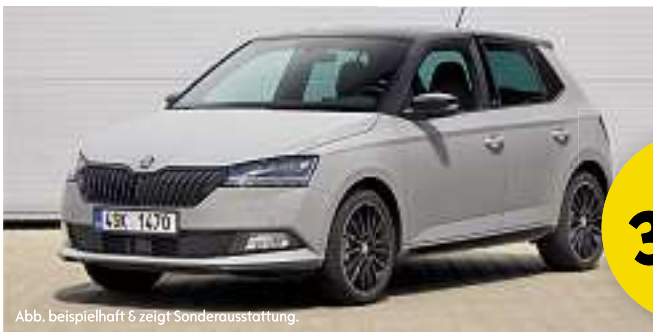
Abb. beispielhaft & zeigt Sonderausstattung.