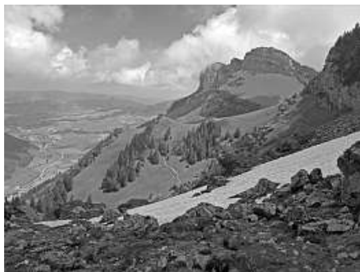
Der Alpstein schenkte den Oberwolfachern ein beeindruckendes Wandererlebnis