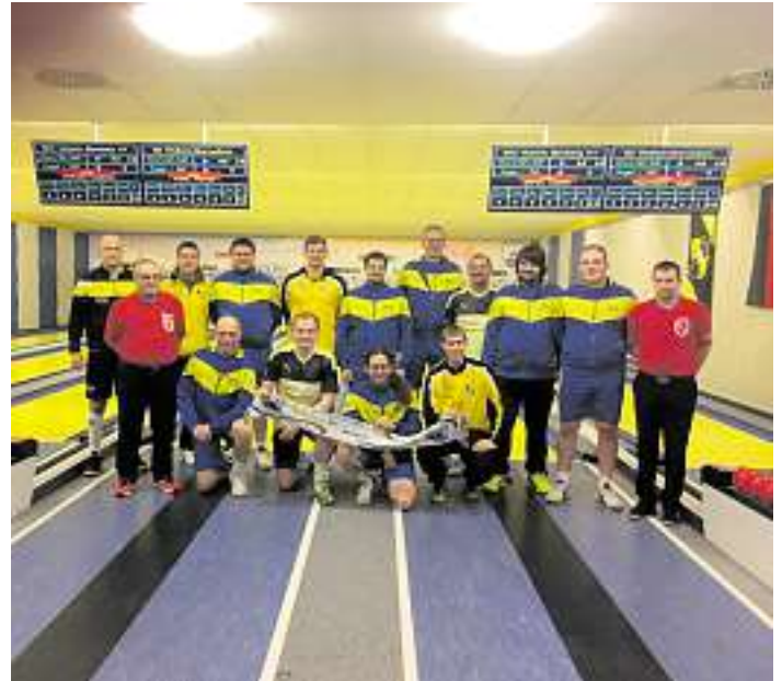
SG 1 mit der aktuellen Nummer 2 Deutschlands dem SKC Victoria Bamberg, welche mit Nationalspielern bestückt sind.

Somit ist der Wettbewerb für die SG beendet. Trotzdem ist man unter die besten 8 Mannschaften im gesamten Bundesgebiet gekommen, was der größte Erfolg der Vereinsgeschichte darstellt.