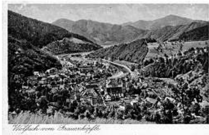
Historischer Ausblick vom Frauenwald/Frauenköpfe über Wolfach hinweg – um 1930!

Rolf Armbruster hat sich zum Start in die neue Wandersaison eine interessante Vorfrühlingswanderung ausgedacht. Nach dem Start um 13 Uhr auf dem Schulplatz geht es gleich über den Grünach hinauf zum Aussichtspunkt am „Elmlle“. Dabei gilt es gleich mal ziemlich steil anzusteigen. Belohnt wird man mit schönen Ausblicken auf den Ortsteil Kirche. Weiter geht der Weg zum Hasenkopf mit 668 Metern. Früher wurden hier schöne Fotos für Ansichtskarten mit Blick auf Wolfach „geschossen“. Zurück wandert man über die Gumm, den Vorstadtberg zunächst nach Wolfach mit geplanter Heimkehr und schließlich über das Schloßle zurück nach Oberwolfach. Für die ca. 9 Kilometer lange Wanderung wird eine Gehzeit von ca. 3,5 Stunden geschätzt. Die Höhenmeter betragen um die 400. Auch Gäste sind willkommen!