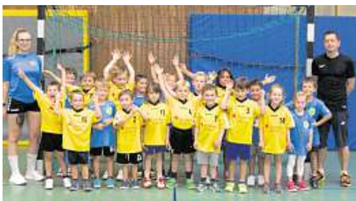
Bild der Mini II Mannschaften der SG Gutach/Wolfach