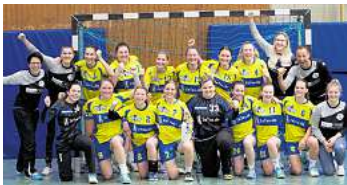
Aufstiegsmannschaft der Damen der SG Gutach/Wolfach