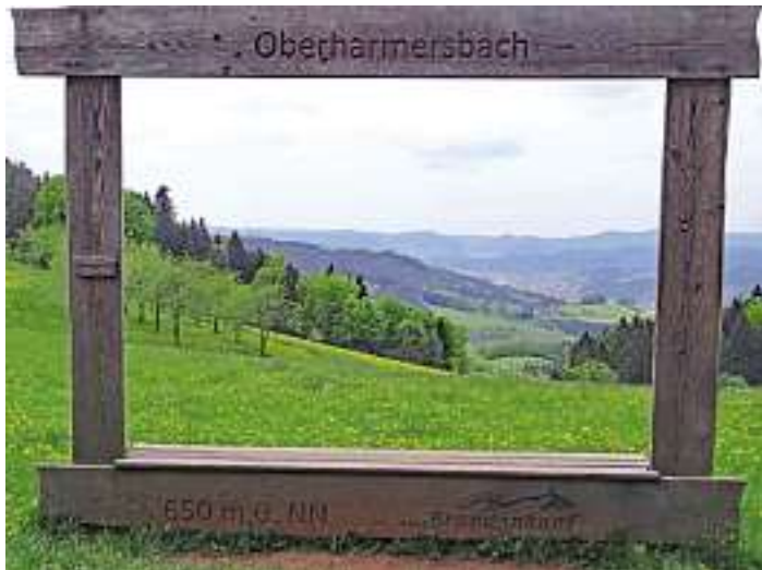
Foto: Unterwegs ein fotogener Ausblick am Langenberg