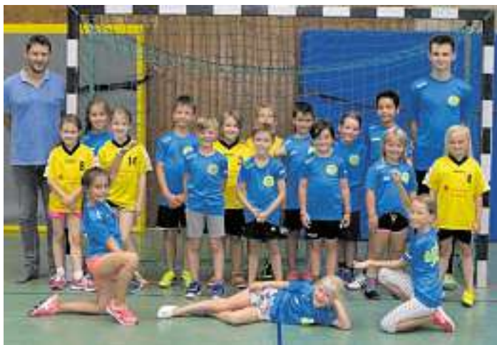
Bild der der Mini I Mannschaften der SG Gutach/Wolfach