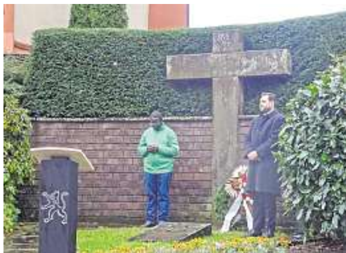
Gedenken und Kranzniederlegung am Ehrenmal in Oberwolfach Text und Fotos: Hans-G. Haas

meister gemeinsam einen Kranz mit einer Schleife in den Gemeindefarben am Ehrenmal nieder.