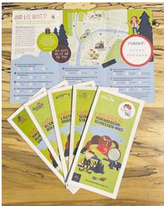
Insgesamt sechs Kinderrallyes in Hornberg, Lauterbach, Gutach, Hausach, Wolfach und Schiltach wurden durch LEADER gefördert.

Alle Stadtrallyes, Infos zu den Leihbollerwagen sowie Tipps und Angebote für Kinder, Gäste und Einheimische gibt es auf www.schwarzwald-kinzigtal.info/familie .“