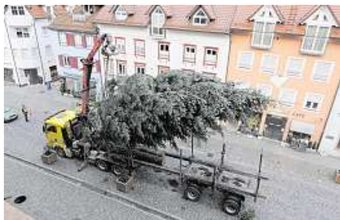
Wie jedes Jahr wird die Tanne mit schwerem Gerät abgelandet, vor dem Rathaus aufgestellt und anschließend befestigt.